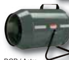
DGP / Astro