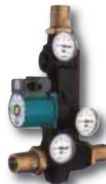
Laddomat 21 Module anti-condensation