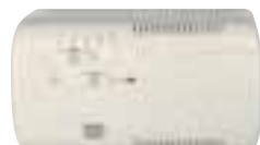
Selecteur de vitesse 0007-203